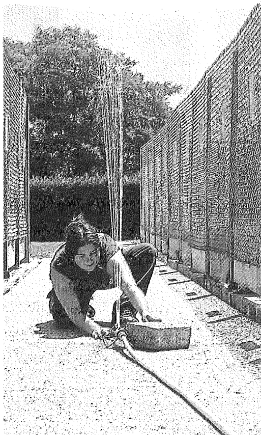
Les bénévoles multiplient les astuces pour que l'ambiance reste sereine.

Mais ce sont surtout les adoptions, au ralenti, qui pénalisent l'établissement en juillet-août : « La gestion des places est plus compliquée. On a moins de latitude face aux incom-